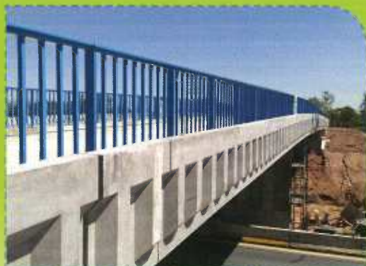
Champs Pasquauds, Vue de l'ouvrage, Août 2016

Les travaux de dénivellation du chemin rural des « Champs Pasquauds » avec la construction d'un ouvrage d'art sont terminés.