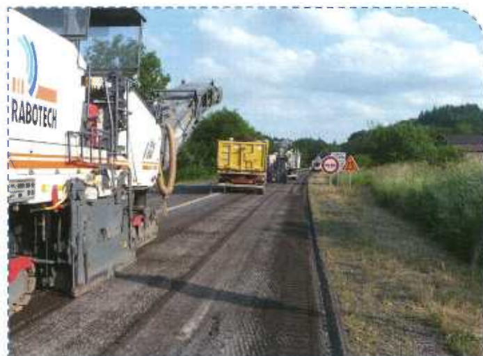
Réfection de chaussées par la DIRCE, juin 2015

Ainsi, cet été, 25 km de routes nationales ont été renouvelés en Saône-et-Loire, avec des contraintes de circulation qui sont parfois venues s'ajouter à celles liées au programme RCEA.