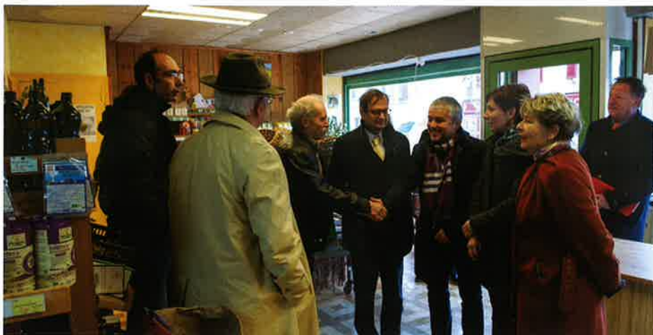
Les acteurs de la Puisaye-Forterre (89) ont pu démontrer leur approche innovante du développement local.

Les acteurs du pays de la Puisaye-Forterre, dans l'Yonne, ont quant à eux