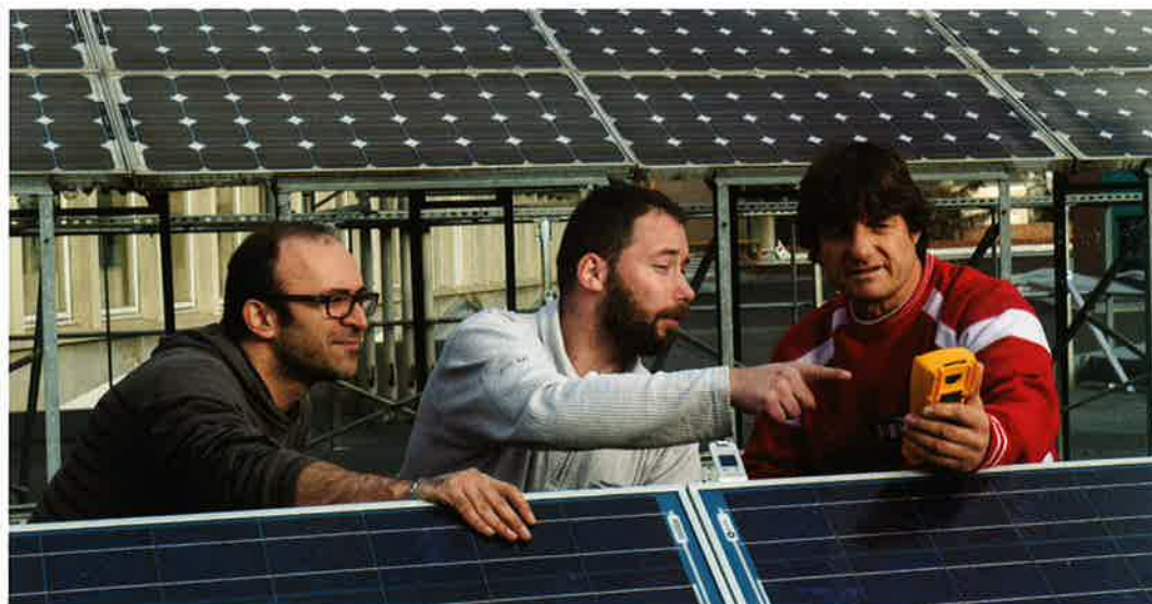
Plus de 12 000 places de formation supplémentaires pour les demandeurs d'emploi seront créées, notamment dans le domaine de la transition énergétique.

Marie-Guite Dufay Présidente de la région Bourgogne-Franche-Comté