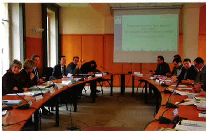
Marie-Guite Dufay et Christiane Barret, préfète de région, ont reçu les agriculteurs, mercredi 9 mars 2016, pour construire un plan d'urgence.

La région, aux côtés de l'État, a élaboré un plan d'urgence, présenté et adopté lors de l'assemblée plénière du 18 mars, pour venir en aide au secteur agricole.