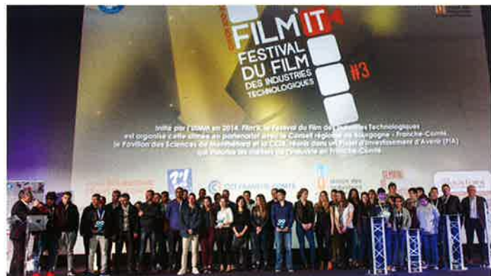
Le festival Film'IT en Franche-Comté permet de développer les échanges entre les jeunes et les entreprises industrielles.

Le projet « Valorisation des métiers de l'industrie (VMI) en Franche-Comté » vise à rendre attractifs les métiers de l'industrie auprès des jeunes, de leurs familles et du secteur de la formation.